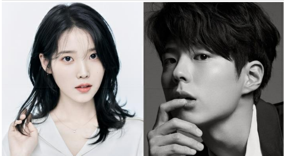
그림1 아이유, 박보검 출연 확정 지은 텐트폴 <폭삭 속았수다>